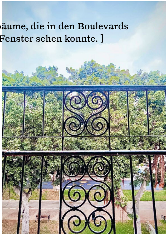
Ficusbäume, Rothschild Boulevard, Tel Aviv, 2023

[ Besonders diese großen Ficusbäume, die in den Boulevards stehen, und die ich von meinem Fenster sehen konnte. ]