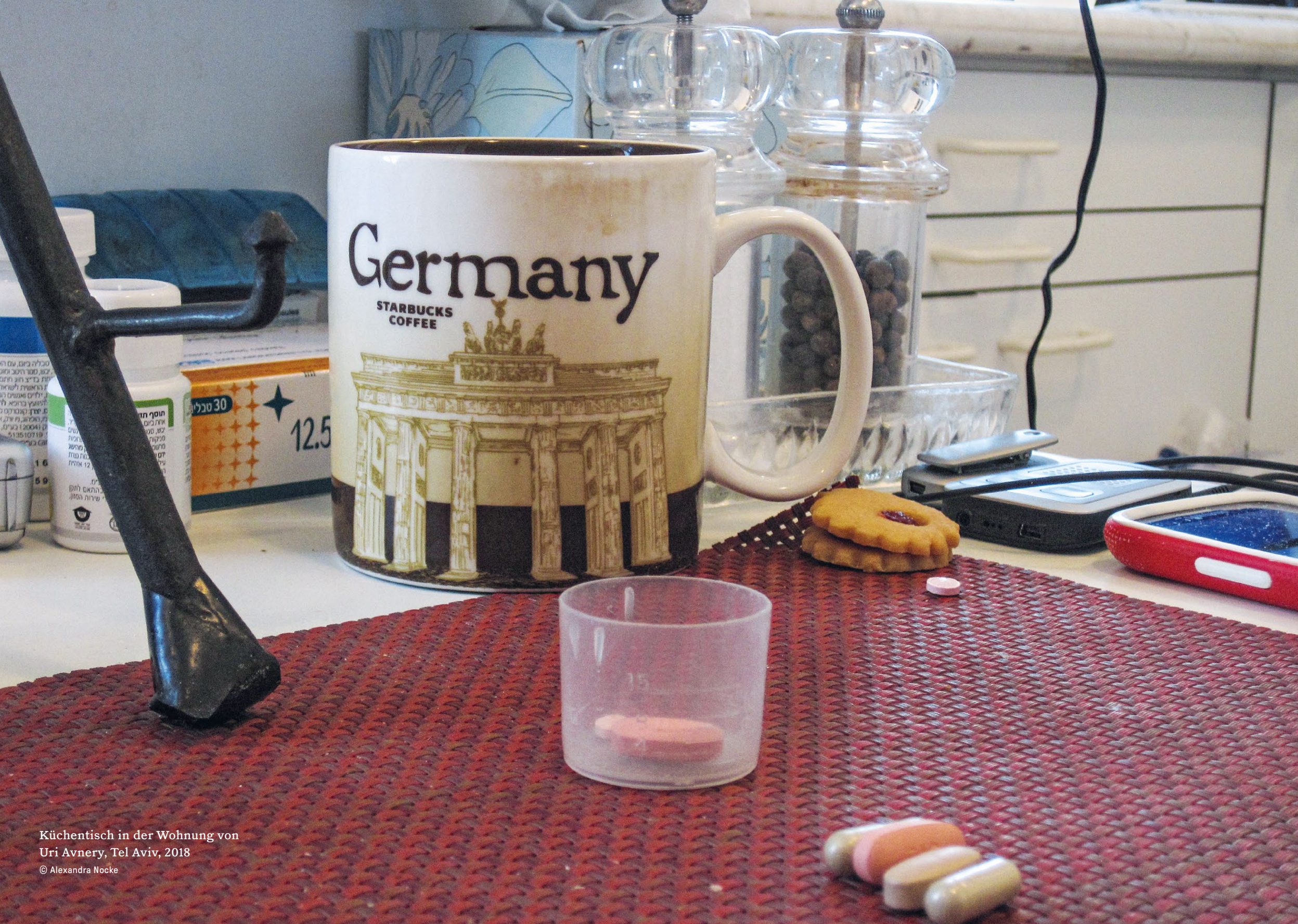
Küchentisch in der Wohnung von Uri Avnery, Tel Aviv, 2018