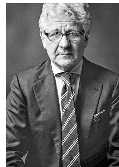
Marcel Reif, 2023